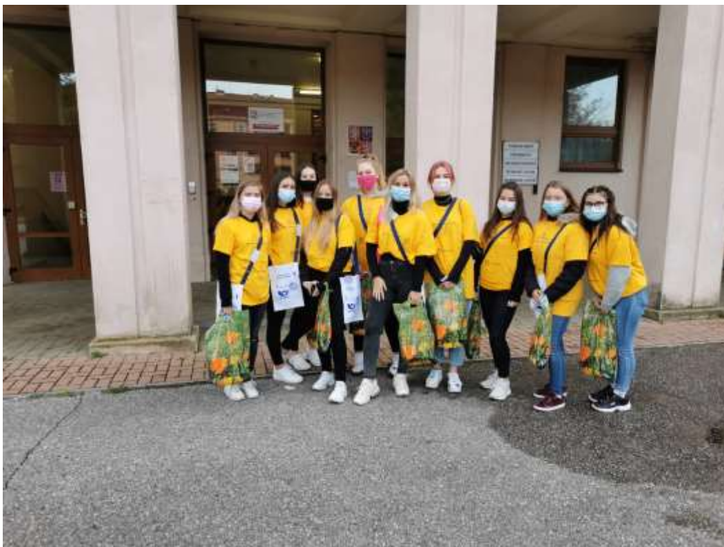
Kytičkový den, září 2020