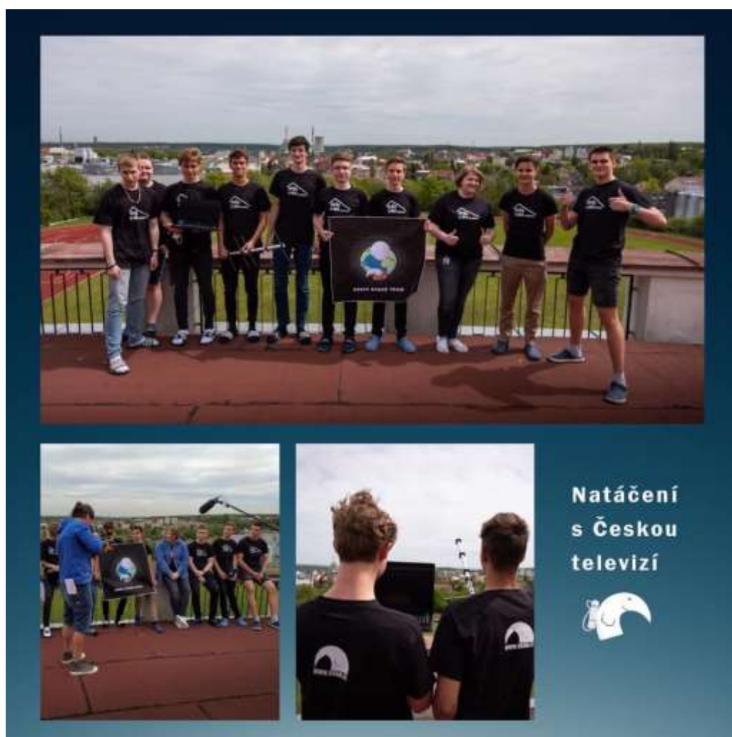
Natáčení s Českou televizí – projekt „Dotkni se vesmíru“

Žákovi s podpůrným opatřením stupně 3 poskytována pedagogická intervence v rozsahu 3 hodiny týdně a má asistenta pedagoga na celý úvazek.