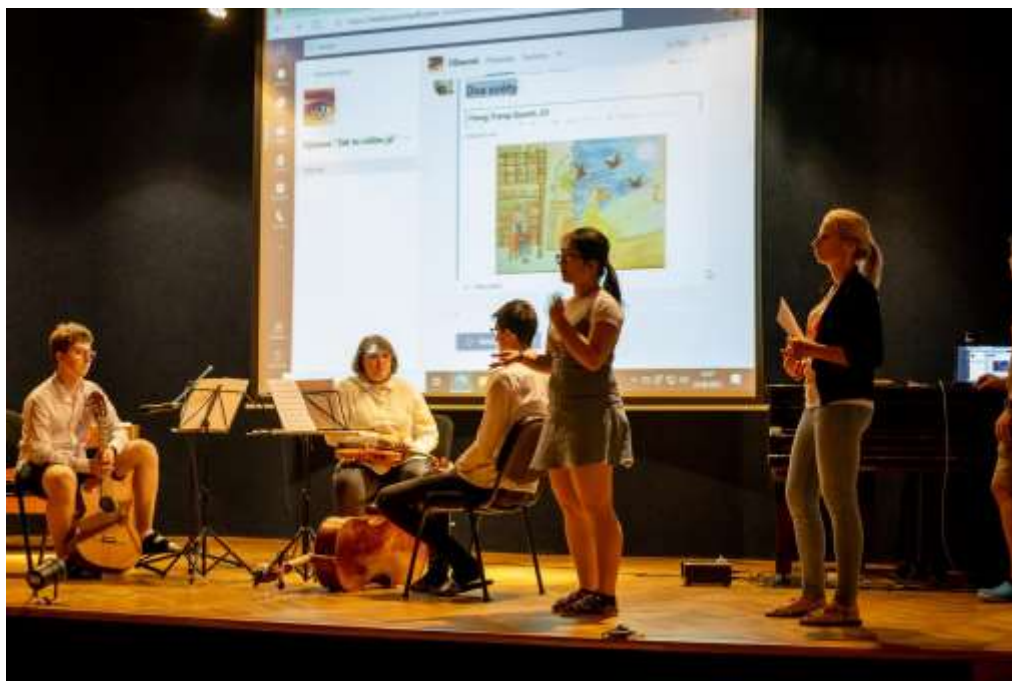
Umělecká výstava a soutěž „Tak to vidím já“, červen 2021

Výchovný program je zaměřen zvláště na oblast občanského a osobního života, soužití v kolektivu, ochranu jedince před patologickými vlivy a šikanou a též na finanční gramotnost. Škola významnou měrou podporuje komunikaci se žáky a vyučujícími, každý žák se má možnost obrátit na učitele i vedení školy a to jak osobně, tak prostřednictvím TEAMS.